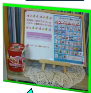
ベルマークの収集