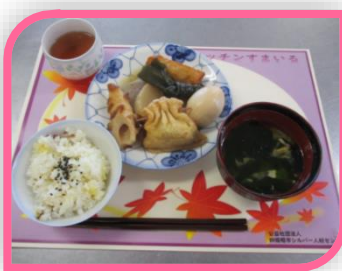
健康寿命延伸のすすめ